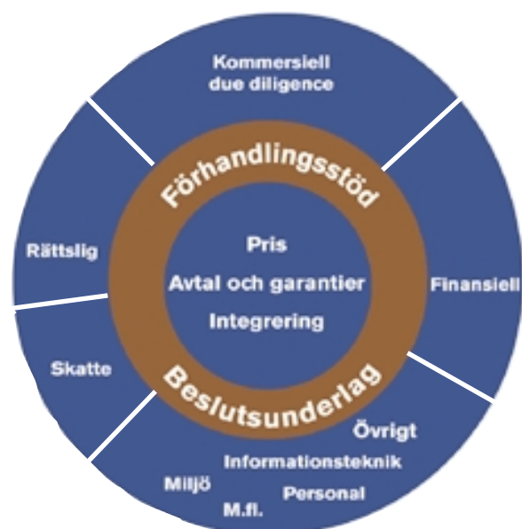
Figur 2: Resultatet av due diligence

På basis av beslut av denna typ kan köparen genomföra de slutliga förhandlingarna med säljaren. Med en väl utförd och kommunicerad företagsbesiktning i ryggen har köparen goda kunskaper om förvärvsobjektet, vilket ger en förstärkt förhandlingsposition. Det kan till och med vara så att köparen är bättre informerad om målföretaget än säljaren. Resultatet av företagsbesiktning kan schematiskt illustreras i enlighet med figur 2.